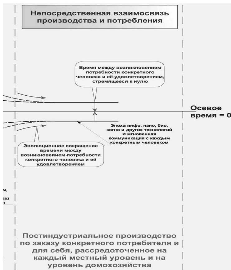
Рис. 2. Условная схема перехода на новую (первую) парадигму развития

Говоря о скандинавской экономической модели, многие подчеркивают, во-первых, что она предполагает самые широкие в мире на