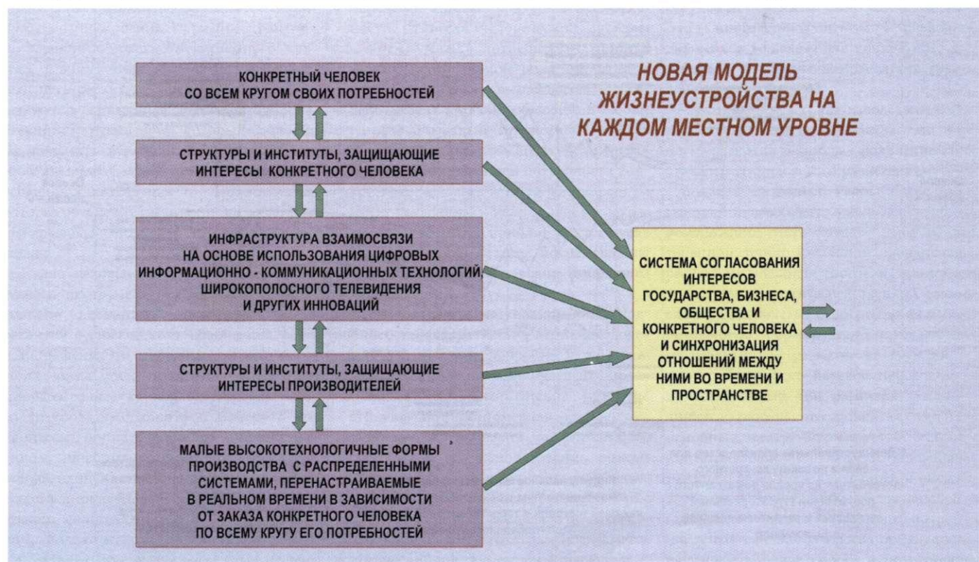
Рис. 2. Новая модель жизнеустройства на каждом местном уровне.

В рамках этой стратегии необходимо разработать и реализовать программу реиндустриализации всего производства, то есть, осуществить перевод производства на рельсы новейших технологий, но конечным ее звеном должны стать малые высокотехнологичные формы производства с распределенными системами, перенастраиваемые в реальном времени в зависимости от требований конкретного человека по всему кругу его потребностей. И вторая задача. Сформировать на каждом местном уровне с помощью цифровых информационно-ком-